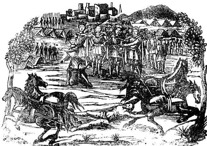
12. Morte di Gano di Maganza traditore.