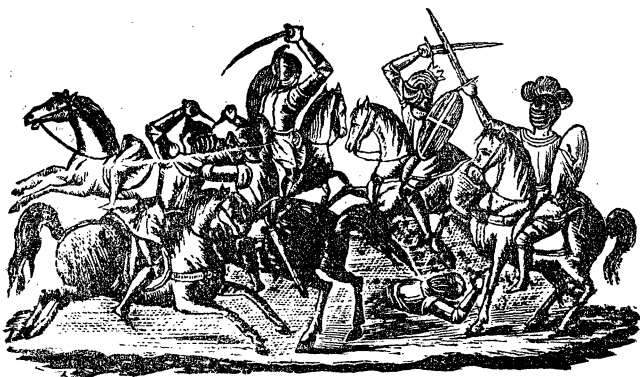
10. Il re di Polonia, il re di Schiavonia e Uneslao combattono contro Carlomagno. Orlando e Rinaldo si uniscono a Carlomagno contro di essi.