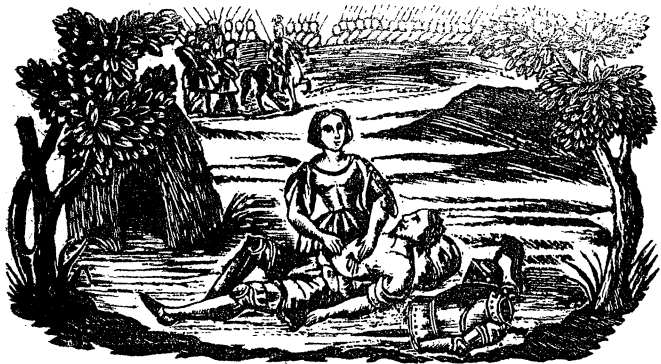
9. Medoro ferito viene soccorso e medicato da Angelica col succo di un'erba presso di lui raccolta.