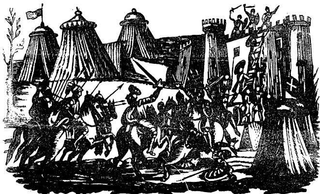
11. Carlomagno assedia la città di Tr magna.